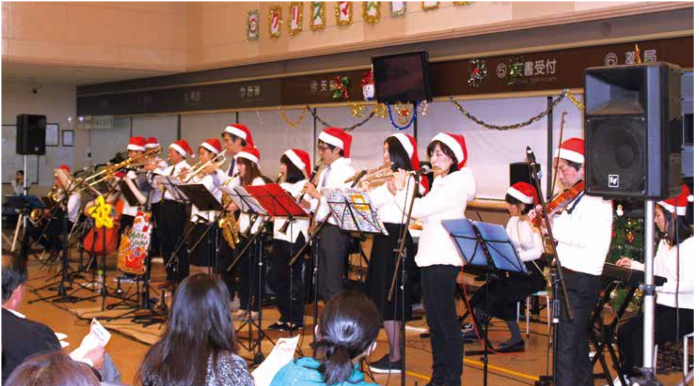
2018年12月15日に当院エントランスホールにてクリスマスコンサートを開催しました。

〒510-8561 四日市市大字日永5 450-132 TEL(059)345-2321(代表) E-mail:sogohos@mie-gmc.jp