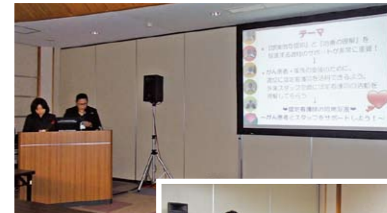
「医療の改善活動」全国大会での「おもしろ隊」の発表

〒510-8561 四日市市大字日永5 450-132 TEL(059)345-2321(代表) E-mail:sogohos@mie-gmc.jp