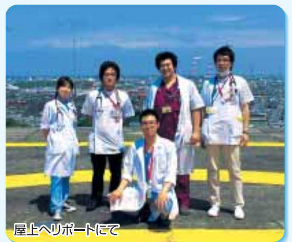
屋上へリポートにて

どこかのニュースでは医療崩壊という言葉も聞かれる最近ですが、これからの三重の医療を担っていく彼らに期待するとともに、皆様方にも応援いただき、地域全体で育てていただければと思いますので、よろしく申し上げます。