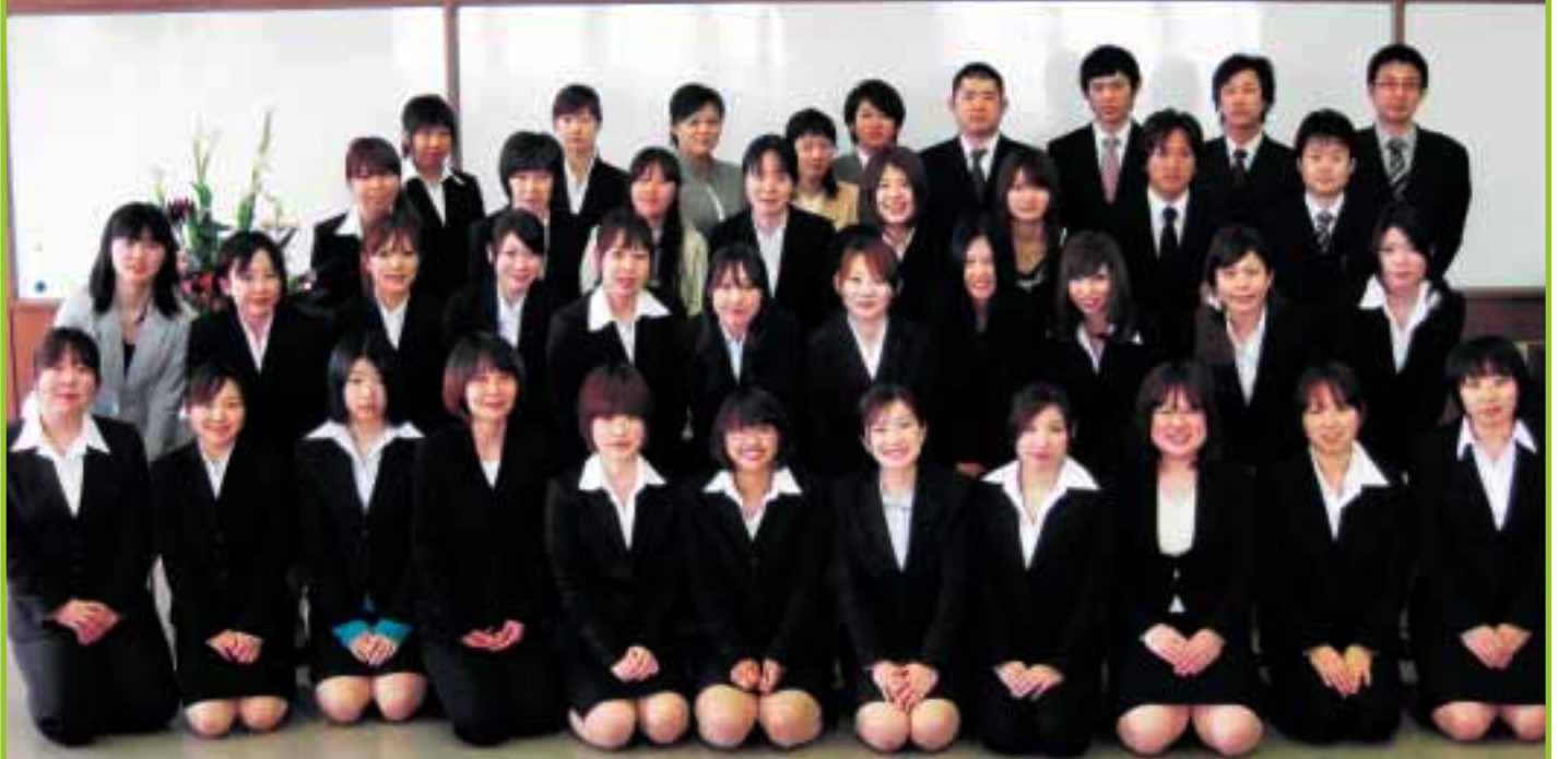
(平成22年度新規採用者)